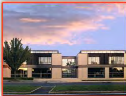
Campus MARTELET (Villefranche-sur Saone)

BTS conception et réalisation de systèmes automatiques