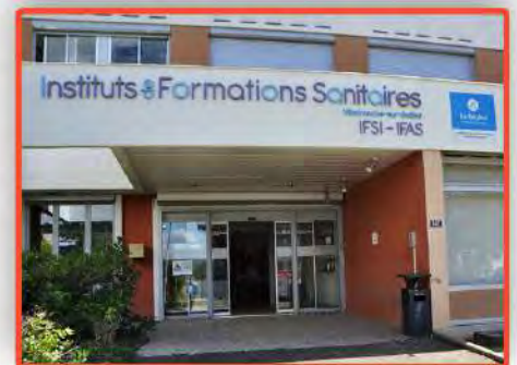
IFSI - IFAS INSTITUT DE FORMATION (Villefranche-sur Saone)

BTS négociation relation Client BTS management BTS comptabilité et gestion BTS assistant manager